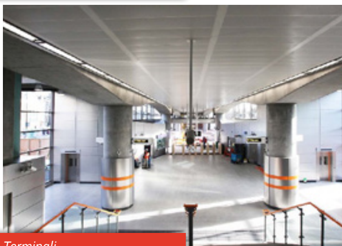
Terminali Shoreditch, East London Line

Prioriteta skupine Rimex Metals Group je servisiranje kupcev in zadovoljstvo kupcev ter v kombinaciji z obsežnim in kontinuiranim programom investiranja namerava skupina Rimex Metals tudi v prihodnosti obdržati vodilni položaj na področju površinske obdelave kovin.