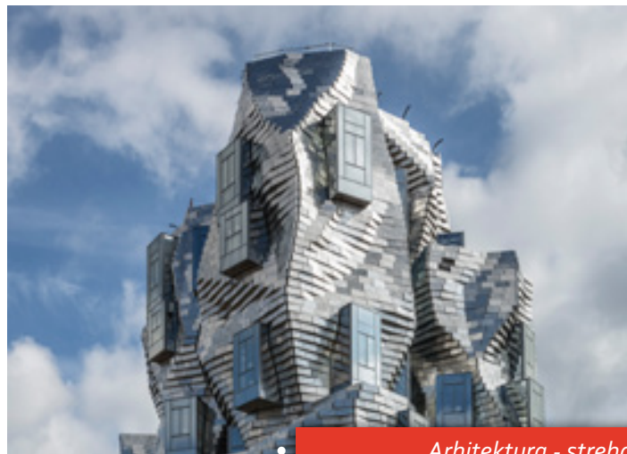
Arhitektura - streha La Luma Aries

S tako široko izbiro površinskih obdelav se je Rimex uveljavil kot vodilni na področju tehnologije površinske obdelave kovin.