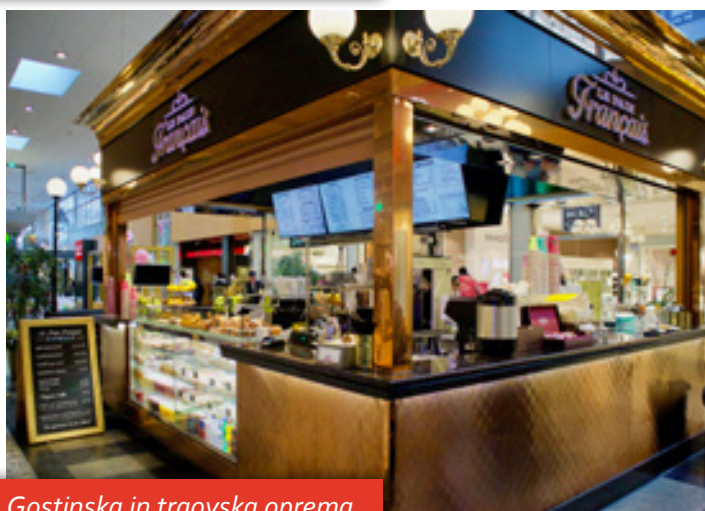
Gostinska in trgovska oprema Le Pain Francais