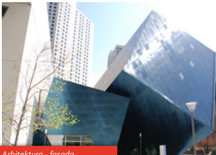
Arhitektura - fasada Jewish Museum

S tako široko izbiro površinskih obdelav se je Rimex uveljavil kot vodilni na področju tehnologije površinske obdelave kovin.